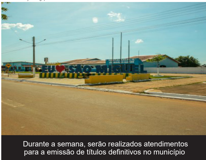
Durante a semana, serão realizados atendimentos para a emissão de títulos definitivos no município

(Da Redação) Produtores rurais de São Miguel do Guaporé e região terão a oportunidade de regularizar as propriedades de forma mais fácil e rápida. Entre os dias 23 e 28 de setembro, o Incra estará com uma equipe itinerante na cidade para oferecer diversos serviços relacionados à regularização fundiária.