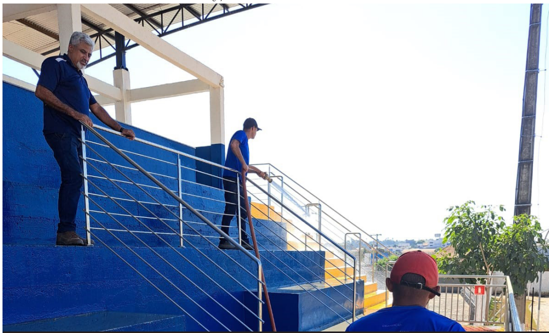
O Campeonato Municipal contará com a participação de 39 equipes na Série A e B

O Campeonato Municipal contará com a participação de 39 equipes na Série