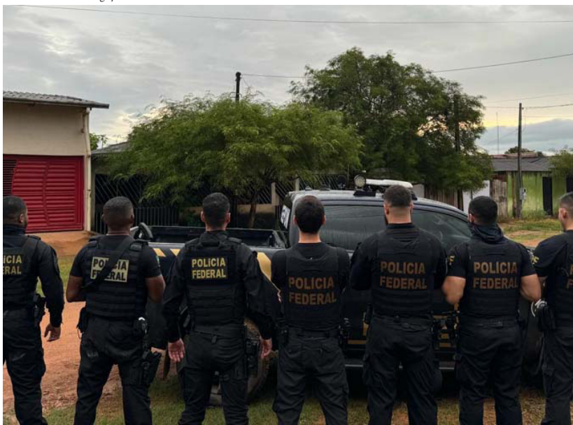
10 policiais federais foram mobilizados para dar cumprimento aos três mandados de busca e apreensão

(Da Redação) A Polícia Federal (PF) deflagrou, na terça-feira (27), a Operação Carga Explosiva, a fim de desarticular grupo criminoso voltado ao contrabando de combustíveis em Rondônia.