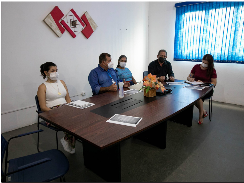
Semusa irá iniciar uma busca ativa pelas pessoas que ainda não completaram a imunização contra a Covid