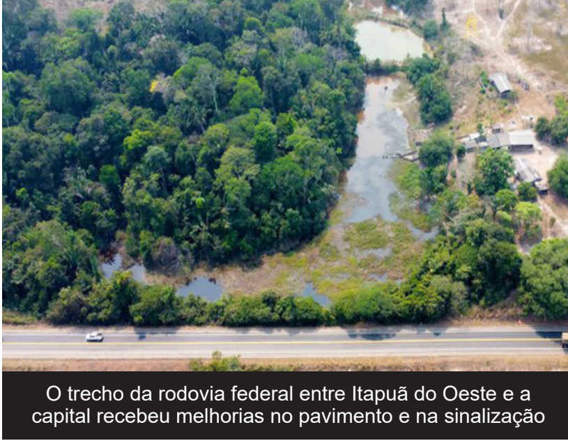
O trecho da rodovia federal entre Itapuã do Oeste e a capital recebeu melhorias no pavimento e na sinalização

do pavimento, seguido da aplicação de uma camada de anti-reflexão com microrrevestimento e recomposição de concreto betuminoso usinado a quente (CBUQ). O chamano retorno do Samuel (km 666,92 e o km 667,38) foram