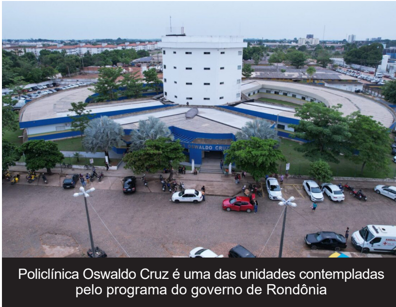
Policlínica Oswaldo Cruz é uma das unidades contempladas pelo programa do governo de Rondônia

cientes e servidores, considerando que a maior parte das instalações é antiga. Logo, os trabalhos colaboram com o zelo do bem público, e vão oferecer maior conforto aos pacientes e colaboradores”, salientou.