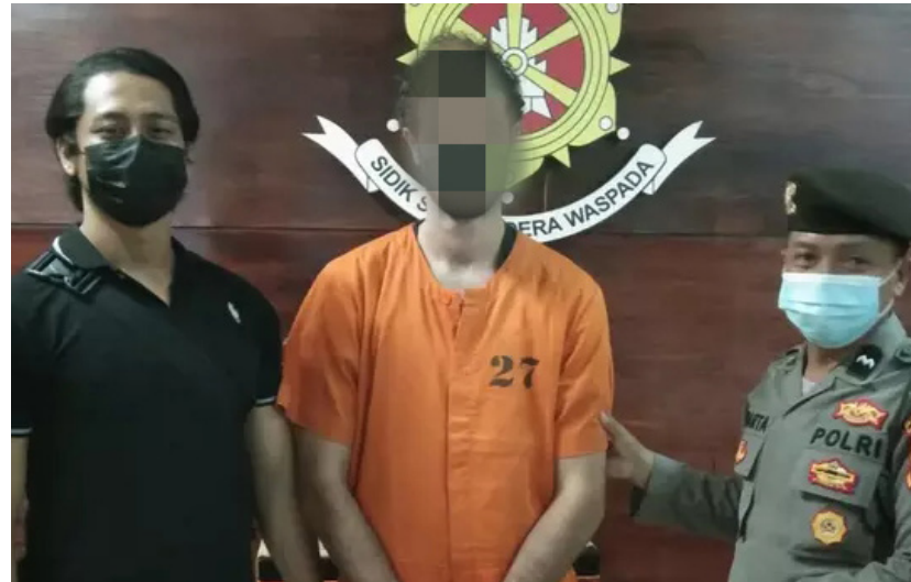
O caso foi registrado no dia 28, mas só foi divulgado à imprensa na noite do dia 7

(Da Redação) Um estudante de medicina brasileiro identificado como (A.S.G), de 25 anos, foi detido após ser encontrado com gramas de maconha em Bali, na Indonésia.