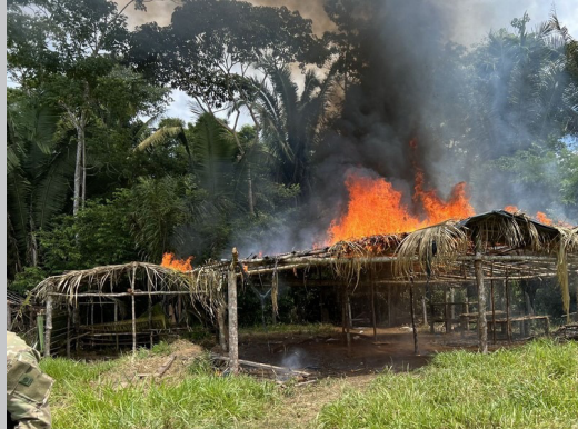
Agentes destruíram oito barracões construídos ilegalmente dentro da Terra Indígena

(Da Redação) Cerca de 50 invasores foram retirados da Terra Indígena (TI) Uru-Eu-Wau-Wau, em Governador Jorge Teixeira, durante uma operação realizada no fim de semana pela Polícia Federal (PF), Fundação Nacional dos Povos Indígenas (Funai) e a Força Nacional. O líder das invasões foi preso em flagrante por contrabando de produtos veterinários. A Operação Tapunhas foi dividida em duas equipes: