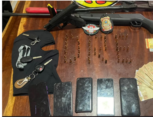
Objetos apreendidos pela Polícia Federal durante Operação Ardil

(Da Redação) A Operação Ardil foi deflagrada pela Polícia Federal (PF), na terça-feira (7), para desarticular um grupo crimino-