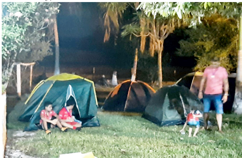
Um encontro e entretenimento aos presentes