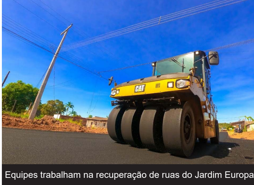
Equipes trabalham na recuperação de ruas do Jardim Europa

de tráfego para os moradores do residencial e, posteriormente, atenderemos outras demandas”, frisou.