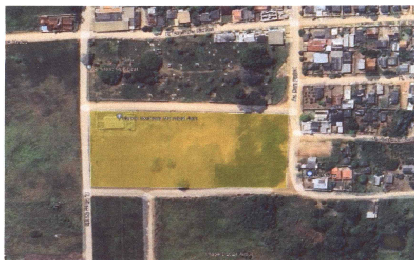
Imagem 01 - Localização da área do Conjunto habitacional Tucumã

Poliana França Fogaça Registradora Interina Portaria nº 106/2022 CGJ