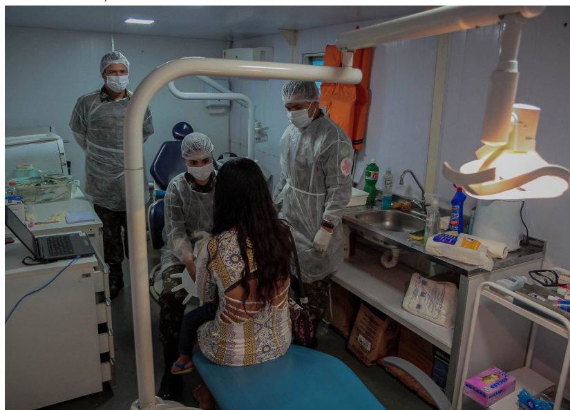
Os ribeirinhos foram beneficiados com atendimentos clínicos, odontológicos, exames laboratoriais e outros serviços

(Da Redação) Nesta quinta-feira (27), o Governo de Rondônia concluiu no município de Costa Marques o ciclo de atendimentos sociais e médicos às comunidades ribeirinhas existentes ao longo dos rios Mamoré e Guaporé, até alcançar o destino final, o Forte Príncipe da Beira.