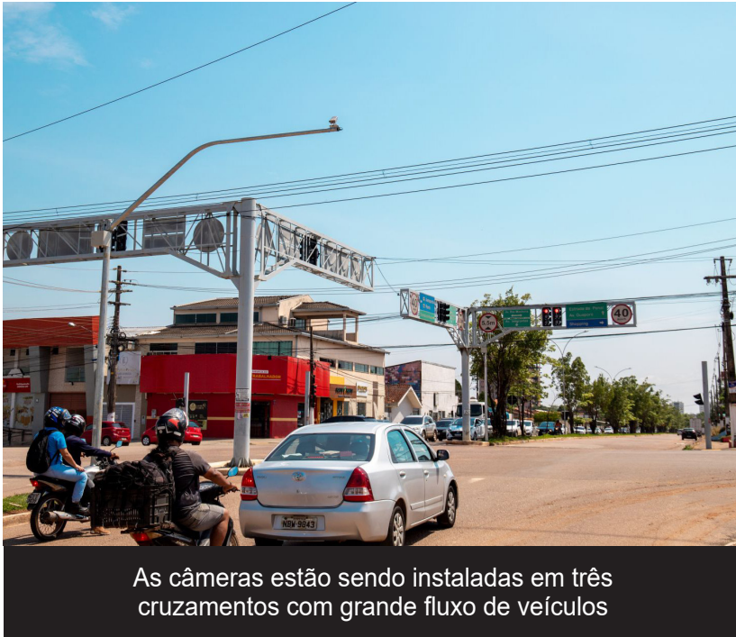
As câmeras estão sendo instaladas em três cruzamentos com grande fluxo de veículos

(Da Redação) Uma medida tecnológica que busca reduzir o engarrafamento, garantir maior eficiência e melhorar o fluxo do trânsito. A Prefeitura de Porto Velho, por meio da Secretaria Municipal de Trânsito, Mobilidade e Transportes (Semtran), iniciou nesta semana a instalação de semáforos inteligentes em pontos estratégicos da capital.