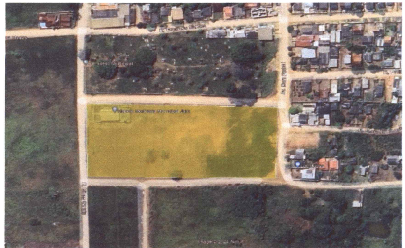
Imagem 01 - Localização da área do Conjunto habitacional Tucumã

Poliana França Fogaça Registradora Interina Portaria nº 106/2022 CGJ