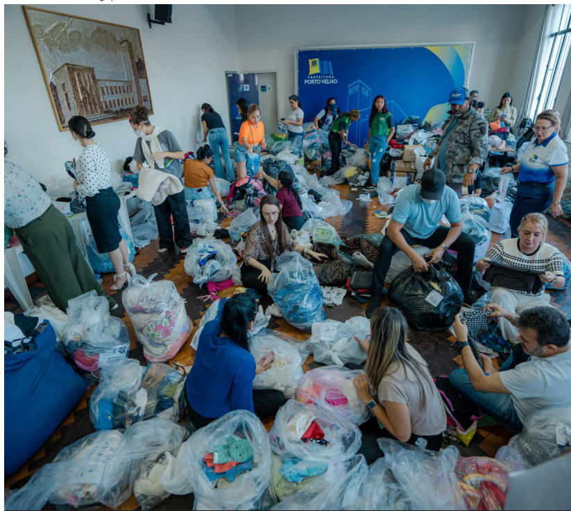
Voluntários e servidores municipais trabalharam para separar e identificar o material

bertores, moletons, brinquedos para as famílias desabrigadas pelas fortes chuvas que atingiram mais