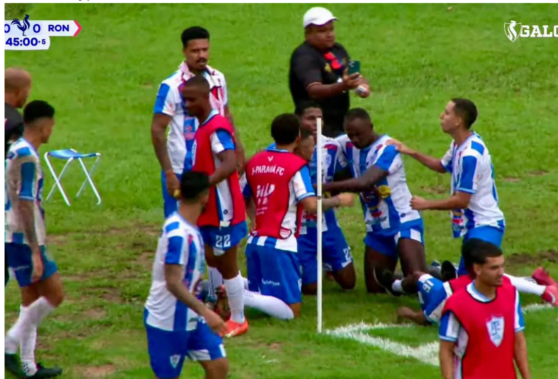
Gol nos minutos finais garante triunfo do Galo da BR sobre o Rondoniense no Estádio Biancão

(Da Redação) A definição da liderança do Campeonato Rondoniense Sicredi foi alterada no fim da 5ª rodada, após os resultados registrados no complemento deste domingo (1º), marcado por partidas equilibradas e disputa direta na parte de cima da tabela.