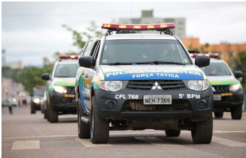
A equipe da Polícia Militar agiu rápido e conseguiu recuperar o veículos roubado do motorista de aplicativo

(Da Redação) Um motorista de aplicativo teve o carro roubado enquanto concluía uma corrida em Porto Velho. A passageira, de 36 anos, foi feita refém pelo suspeitos e jogada para fora do veículo em movimento.