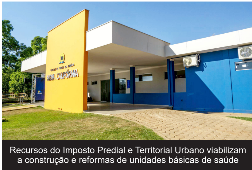
Recursos do Imposto Predial e Territorial Urbano viabilizam a construção e reformas de unidades básicas de saúde

(Da redação) O investimento contínuo em equipamentos, estrutura física e profissionais é prioridade na Prefeitura de Porto Velho para garantir a melhoria dos serviços de saúde prestados à população. Em 2022, parte dos recursos captados pelo município foram aplicados na Secretaria Municipal de Saúde (Semusa), para atender moradores da capital e dos distritos.