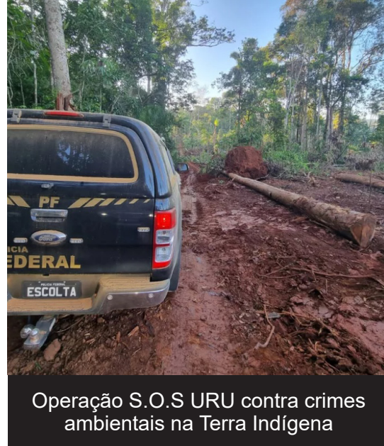
Operação S.O.S URU contra crimes ambientais na Terra Indígena

(Da Redação) Foi deflagrada nesta terça-feira (28), a segunda fase da Operação S.O.S URU para combater crimes ambientais na Terra Indígena Uru-Eu-Wau-Wau em Rondônia. A ação é feita pela Polícia Federal (PF), com apoio da Fundação Nacional do Índio (Funai), Instituto Brasileiro do Meio Ambiente e dos Recursos Naturais Renováveis (Ibama) e Polícia Militar (PM).