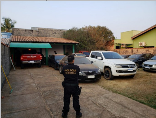
Os veículos apreendidos estavam escondidos numa residência em Vilhena

(Da Redação) A Polícia Federal deflagrou, na quinta-feira (8), a Operação Ártico, com o objetivo de cumprir dois mandados de prisão e quatro mandados de busca e apreensão, em Vilhena, expedidos pela Vara Criminal de Olímpia (SP).