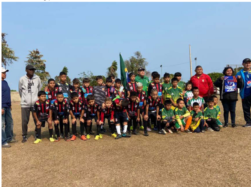
A Escola de Futebol da WS FURACÃO de Jaru, conquistou o título na Categoria Sub-12