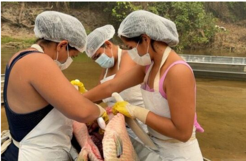
A venda e divisão dos valores são de responsabilidade da Associação dos Seringueiros do Vale do Guaporé

vação estadual de uso sustentável da Resex do Rio Cautário.