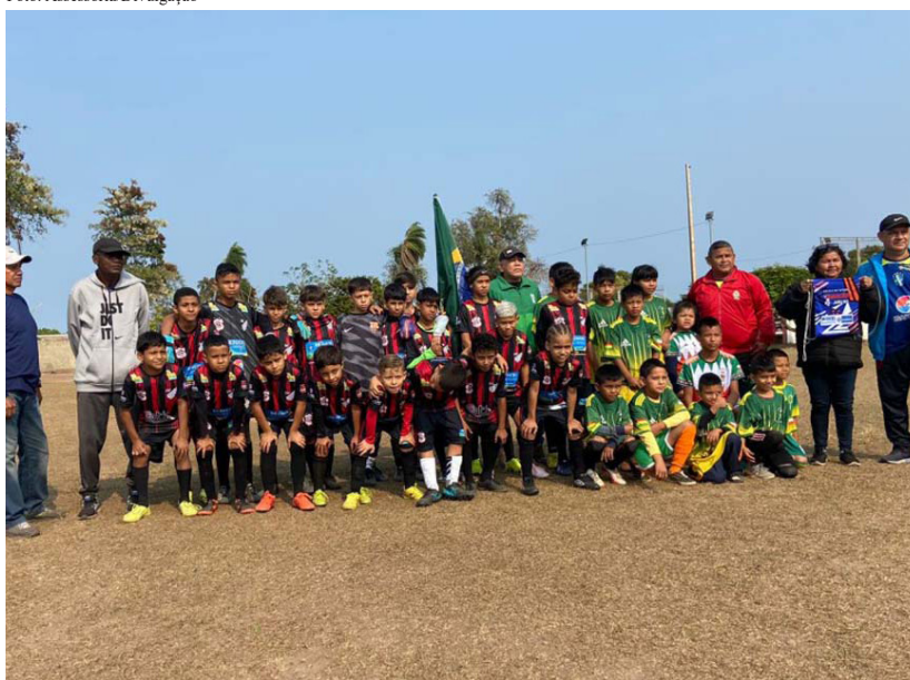
A Escola de Futebol da WS FURACÃO de Jaru, conquistou o título na Categoria Sub-12