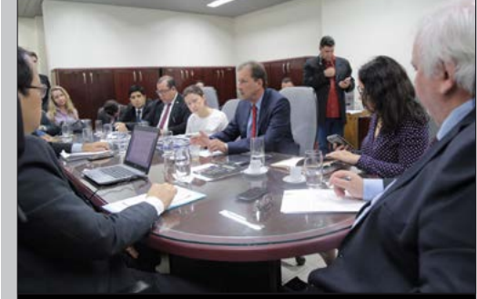
Representantes do Sitetuperon e Consórcio SIM durante audiência trabalhista realizada no Tribunal Regional do Trabalho

(Da Redação) Na quarta-feira (23), representantes do Sitetuperon e Consórcio SIM tentaram chegar a um acordo para por fim à greve no transporte coletivo de Porto Velho, durante audiência trabalhista realizada no Tribunal Regional do Trabalho (TRT). No entanto, como não chegaram a um acordo, a presença do prefeito Hildon Chaves foi solicitada e, no início da tarde. Após várias horas de diálogo, os trabalhadores decidiram encerrar imediatamente a greve e retornar às atividades.