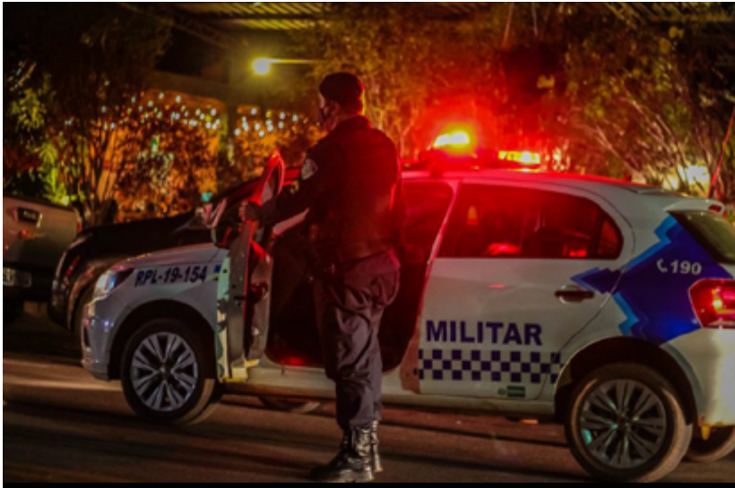
Patrulhamento ostensivo será reforçado durante o final deste ano para coibir prática criminosa em todo Estado

(Da Redação) Com a chegada do final do ano, onde ocorrem as tradicionais festas natalinas e de réveillon, a Polícia Militar de Rondônia (PMRO) começa a preparar estratégias para executar ações preventivas, reforçando seu efetivo operacional para garantir o patrulhamento ostensivo em Porto Velho e no interior do Estado, visando manter a segurança da população.