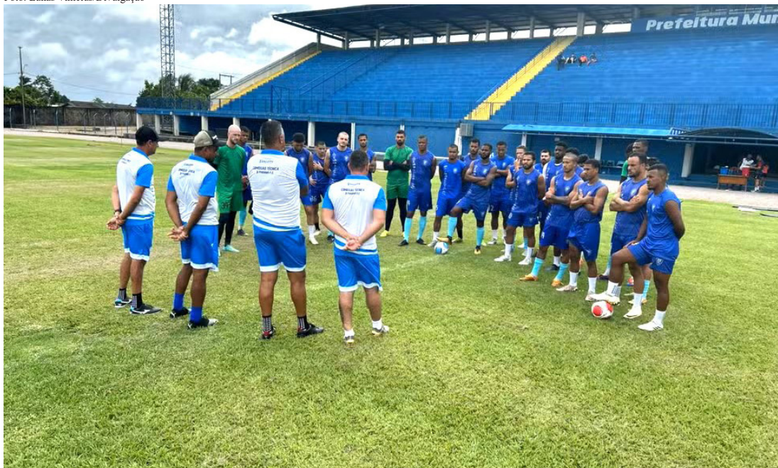
O Ji-Paraná Futebol Clube volta a jogar, hoje, 12, às 20h, contra o Rolim de Moura

“O Rondoniense não é um campeonato fácil, tem logística difícil, campos pesados. Mas, se tivermos a mesma vontade e disposição que mostramos hoje, temos tudo para fazer um grande jogo diante da nossa torcida”, garantiu o treinador.