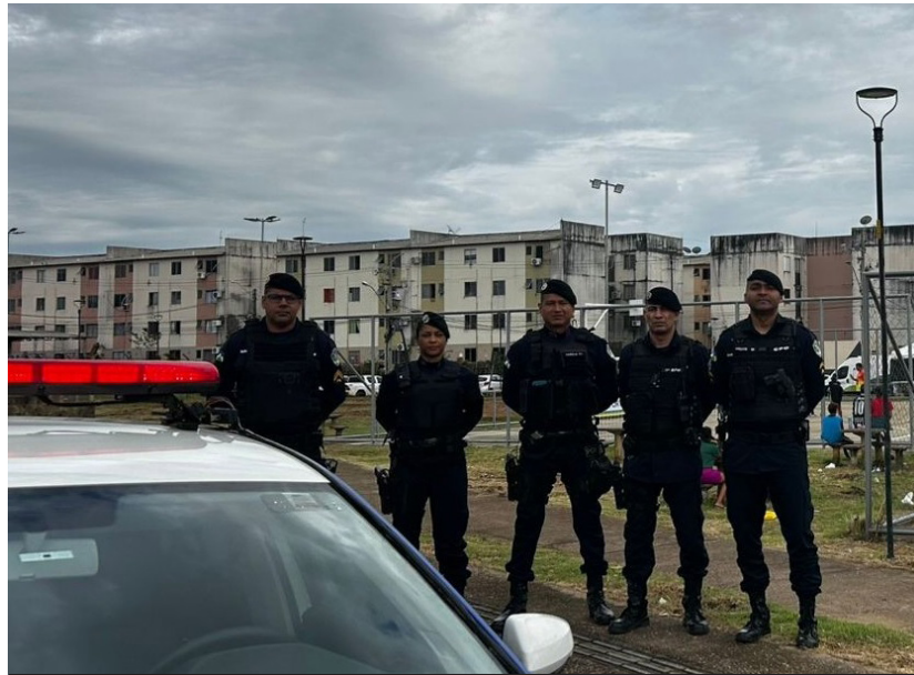
Com as prisões realizadas, os imóveis foram devolvidos aos seus verdadeiros proprietários

(Da Redação) A operação 'Aliança pela Vida, Moradia Segura', iniciada em dezembro de 2024, no Condomínio Morar Melhor, em Porto Velho, tem como objetivo a prisão de foragidos da justiça, coibir o tráfico de drogas, apreensão de armas e objetos que tenham sido adquiridos de forma ilícita por membros de organização criminosa que se instalaram nos imóveis.