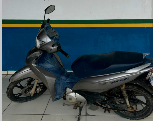
A ação policial foi desencadeada após uma denúncia anônima

(Da Redação) A atuação rápida e eficiente da Polícia Militar de Rondônia realizada, na segunda-feira (3), por meio do Grupamento PM do Vale do Paraíso, resultou na recuperação de uma motocicleta furtada em Ouro Preto do Oeste. A ação policial foi desencadeada após uma denúncia anônima, evidenciando o papel fundamental da população no combate ao crime.