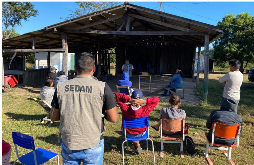
Técnicos da Sedam realizaram palestras na Terra Indígena Rio Mequens, no município de Alto Alegre dos Parecis

de Gestão Ambiental em Terras Indígenas (PNGATI). A ação foi desenvolvida pela Coordenadoria de Povos Indígena (Copin).