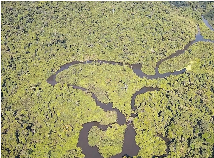
Delegacia de Repressão ao Crime Organizado deflagrou a 7ª fase da operação, que investiga invasão de terras públicas no estado

(Da Redação) A Polícia Civil de Rondônia (PCRO), em conjunto com o Ministério Público do Estado (MPE-RO), deflagrou na manhã de quinta-feira (6), a Operação Anomia, que tem por objetivo desarticular uma organização criminosa envolvida na ocupação, venda e exploração ilegal de terras no Parque Estadual Guajará-Mirim e em parte de sua zona de amortecimento.