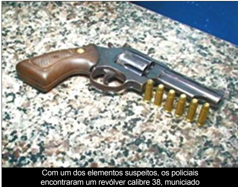
Com um dos elementos suspeitos, os policiais encontraram um revólver calibre 38, municiado