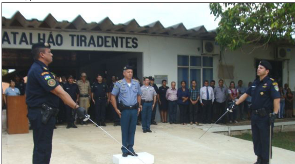
A solenidade ocorreu no final da tarde desta terça-feira e foi presidida pelo comandante-geral da Polícia Militar de Rondônia