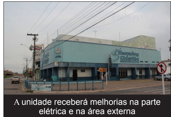
A unidade receberá melhorias na parte elétrica e na área externa

com o cidadão, para que seja mais agradável a sua permanência nas dependências do prédio, enquanto aguarda por atendi-