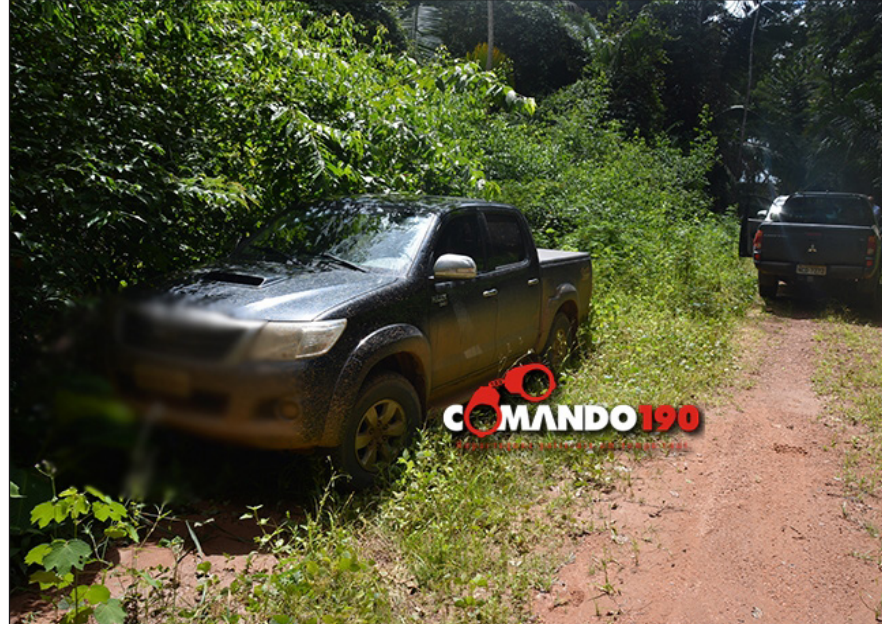
Policiais de Ji-Paraná localizaram o veículo abandonado em um carreador próximo a Ouro Preto do Oeste

Na manhã da última segunda-feira (20), um vendedor que saía de uma clínica quando foi abordado por dois homens armados no bairro 2 de Abril, 1º distrito. Um deles chegou a engatilhar a arma e encostar na cabeça da vítima, mencionando que iria atirar caso ela reagisse.