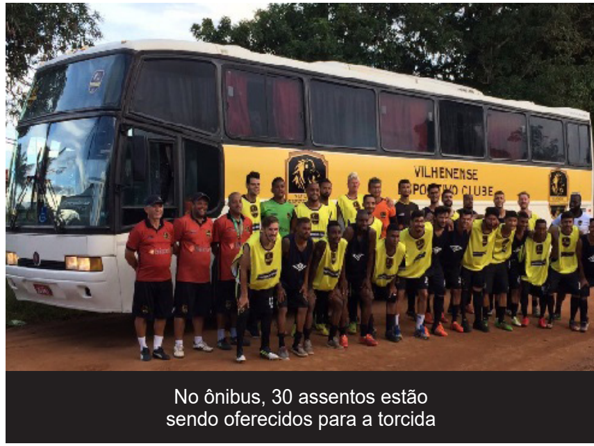
No ônibus, 30 assentos estão sendo oferecidos para a torcida

O convite é estendido a todos os torcedores e simpatizantes do clube. Os diretores pedem as pessoas venham saborear uma deliciosa feijoada ao som do pagode do Art Fina. O almoço começará a ser servido a partir das 11h e tem ainda o objetivo esquen-