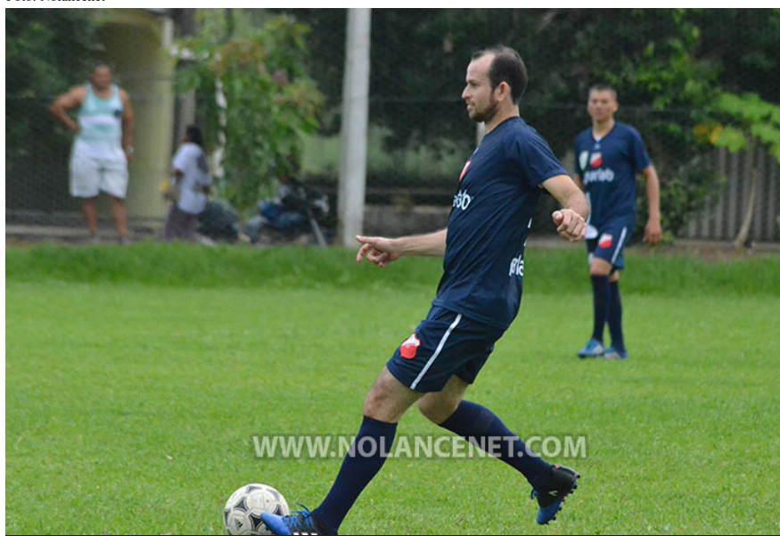
Com mais uma vitória, Pharlab se isolou na liderança do tradicional Campeonato Trintão

da tarde, no campo do Cantareira, se enfrentaram Pharlab x São Bernardo, num confronto dos opostos. Enquanto o São Bernardo tentava uma vitória para fugir da lanterna, o Phalarb tinha como objetivo