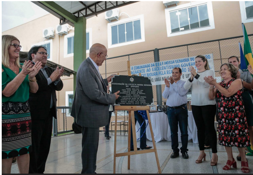
Confúcio Moura: escolas são a boa notícia diante de tantas notícias ruins no país

(Da Redação) A Escola Estadual de Ensino Fundamental Nossa Senhora do Amparo, localizada no bairro Agenor de Carvalho em Porto Velho, foi entregue solenemente à população na segunda-feira (2). A estrutura inclui, além das salas de aula, área para convivência da comunidade e alunos, ginásio poliesportivo coberto e biblioteca entre outros espaços. As aulas começam amanhã (4).