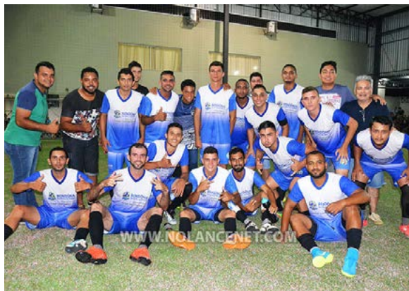
Reforçado com jogadores de Ouro Preto, o Comercial fez campanha brilhante, chegando invicto ao título

(Chico Limeira) Em jogo acirrado, realizado na noite desta quarta-feira (4), no Saint Germain, o Comercial FC venceu por 6 x 4 a forte equipe do FC Social, sagrando-se campeão da 2ª Copa Brahma de futebol 7 soçaite, de Ji-Paraná.