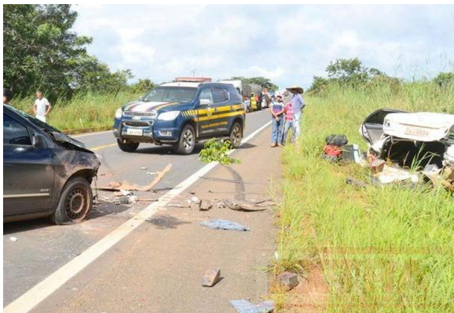
O Corolla foi jogado fora da rodovia e ficou parcialmente destruído

De acordo com o condutor do Corolla, ele trafegava pela rodovia sentido Porto Velho e ao ultrapassar uma carreta foi impedido de continuar com a manobra. Com isso, o motorista perdeu o controle da direção, rodou na pista e foi atingido pelo Gol que transi-