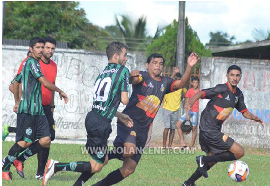
Com um empate sem gols, Grêmio Novo Horizontino se garante nas quartas de final da Taça Inverno Airton Gurgacz

ataque, o Flamenguinho de São Miguel venceu por 2 x 0 e segue na briga pelo título.