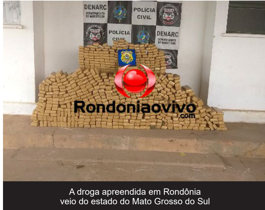
A droga apreendida em Rondônia veio do estado do Mato Grosso do Sul

estava dentro de um carro modelo Fiesta que vinha para a Porto Velho, escoltado por mais dois carros modelo Gol. A apreensão foi totalizada em 424 quilos de maconha.