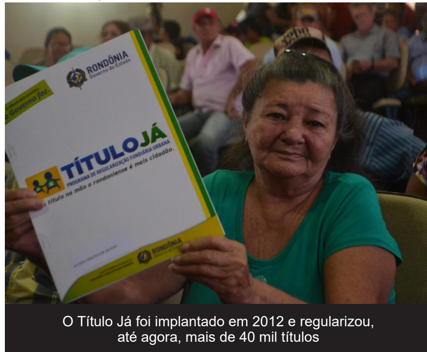
O Título Já foi implantado em 2012 e regularizou, até agora, mais de 40 mil títulos

De acordo com a gerente da Sepat, o programa Título Já, implantado em 2012 pela lei estadual nº 2910/12, já atendeu até agora 41.792 famílias carentes nos municípios de Alvorada do Oeste, Ariquemes, Buritis, Cacoal, Governador Jorge Teixeira, Ji-Paraná, Jaru, Pimenta Bueno, Presidente Médici, Primavera de Rondônia, Rolim de Moura, São Felipe do Oeste, São Francisco do Guaporé e Theobroma, onde o Governo do Estado investiu R$ 4,2 milhões em regularização fundiária urbana, possibilitando a essas famílias a garantia legal do direito de propriedade, com a