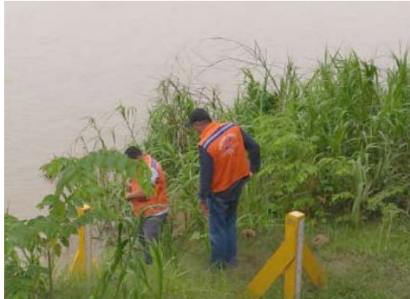
Técnicos têm acompanhado de perto o comportamento do rio; prefeitura está pronta para agir

A Coordenadoria de Proteção e Defesa Civil do Município esteve, durante o final de semana, realizando monitoramento em comunidades do Baixo Madeira, com o objetivo de orientar moradores de como agir caso o rio ultrapasse a marca de alerta, de 14 metros e 50 centímetros, quando algumas casas poderão ser invadidas pelas águas. Atualmente o nível do rio está em 13,76 metros, o que é normal para a época do ano, e não representa ameaça aos ribeirinhos.