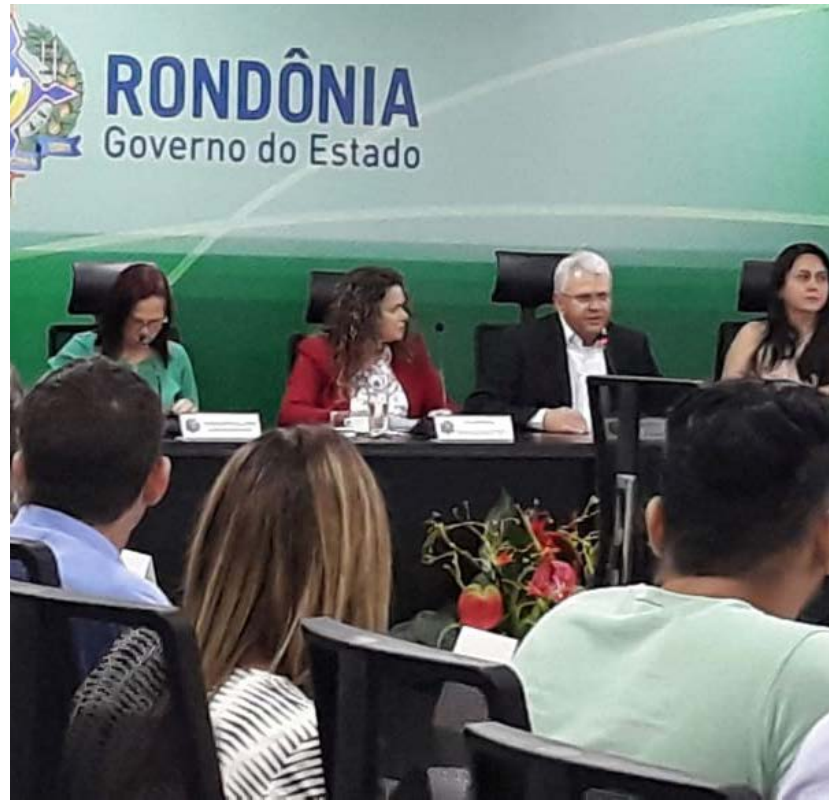
Reunião foi realizada no Palácio Rio madeira e teve a presença do vice-governador, José Jodan

(Da Redação) O alinhamento das ações na área da assistência social para que sejam minimizadas situações problemáticas em busca de um objetivo comum do governo estadual, que é melhorar a qualidade de vida da população de Rondônia, foi o foco da 35ª Reunião da Comissão Intergestores Bipartite (CIB) realizada, na quinta-feira (21), no Palácio Rio Madeira, em Porto Velho, com a participação de representantes dos 52 municípios, sob o comando da Secretaria de Estado da Assistência