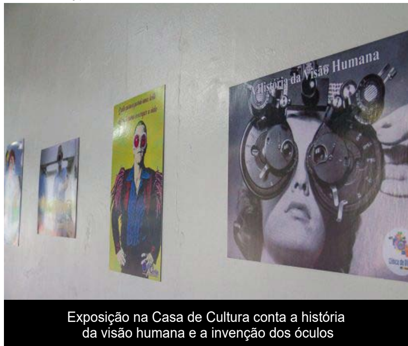
Exposição na Casa de Cultura conta a história da visão humana e a invenção dos óculos

posição e diretora da unidade, a iniciativa partiu de um grupo de oftalmologistas e empresários do ramo, que se juntaram para mostrar a história dos óculos e a importância de um dos principais sentidos humanos: a visão.