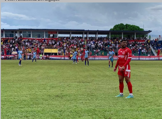
Três jogos marcam a abertura da competição, no dia 17 de fevereiro

(Da Redação) Três jogos abrem a 34ª edição do Rondoniense 2024, a competição mais importante do calendário da FFER terá início com dois jogos no sábado, dia 17 de fevereiro, às 15h30 jogam Barcelona e Porto Velho no estádio Aluizio Ferreira e Real