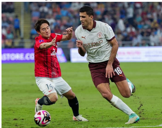
Clube inglês passou fácil pela semifinal e encara o tricolor na decisão

(Da Redação) enquanto Kovacic e Bernardo Silva fecharam a conta.