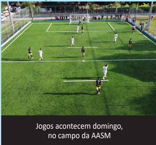
Jogos acontecem domingo, no campo da AASM

posto por: AJS, Amigos da Bola, Capelasso, Gilbertinho Brindes e Na Brasa. No Grupo B: Clube Master Ji-Paraná, Curitiba Calçados, Juventude, NSI/Belini e Vila Rondônia. O torneio de abertura terá início, às 8h, no campo da AASM. No primeiro confronto, jogam Capelasso x Clube Master Ji-Paraná. Às