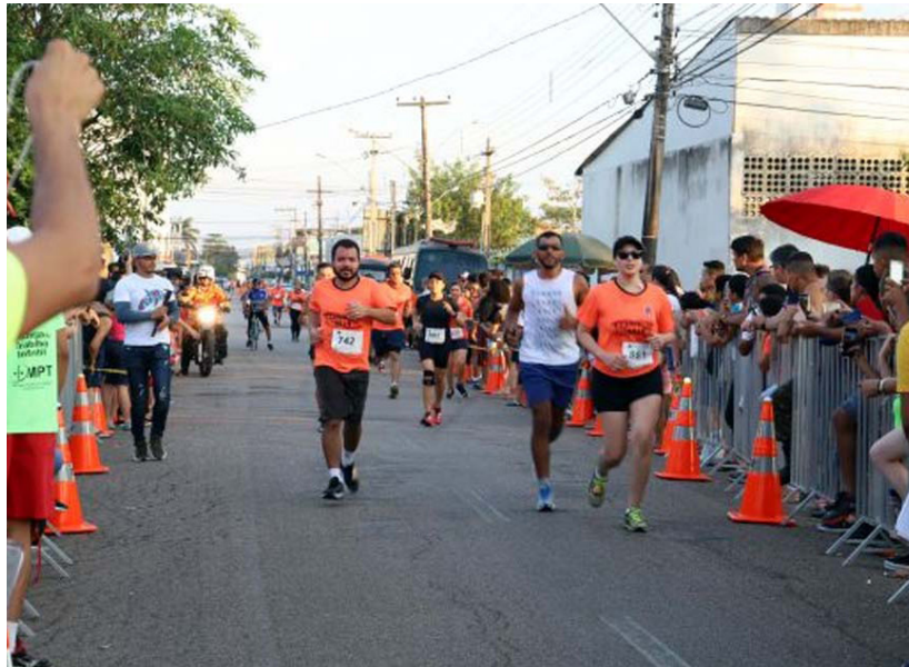
A corrida é uma parceria entre o governo de Rondônia e a 17ª Brigada de Infantaria de Selva