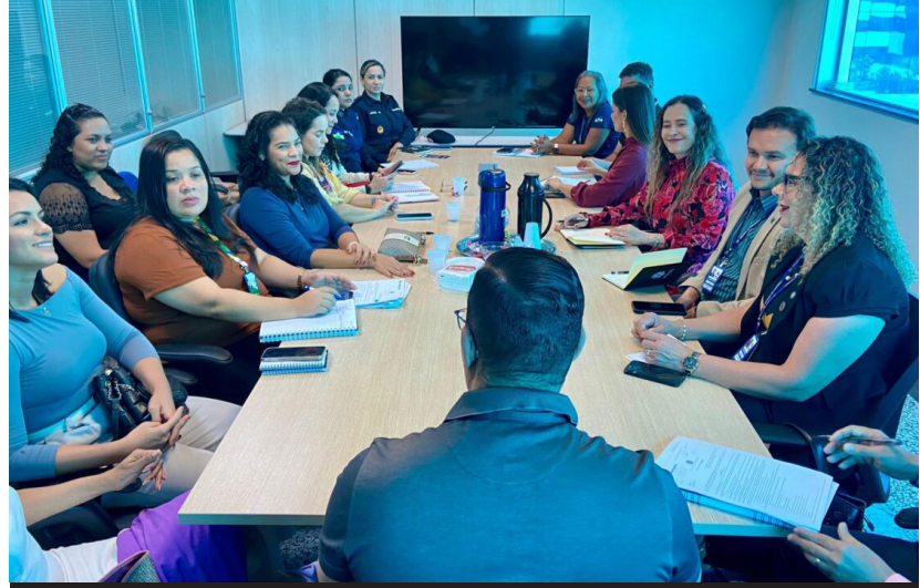
Grupo de trabalho já iniciou reuniões e apresentará um plano de ação detalhado

(Da Redação) Com o objetivo de fortalecer o combate à violência doméstica, o governo de Rondônia formou, na sexta-feira (2), um grupo de trabalho para colaborar com várias instituições para desenvolver estratégias e reduzir os casos deste tipo de violência no estado. A expectativa é que, com a união de esforços, seja possível reduzir os casos de violência doméstica em Rondônia, trazendo mais segurança e dignidade para as famílias do estado.