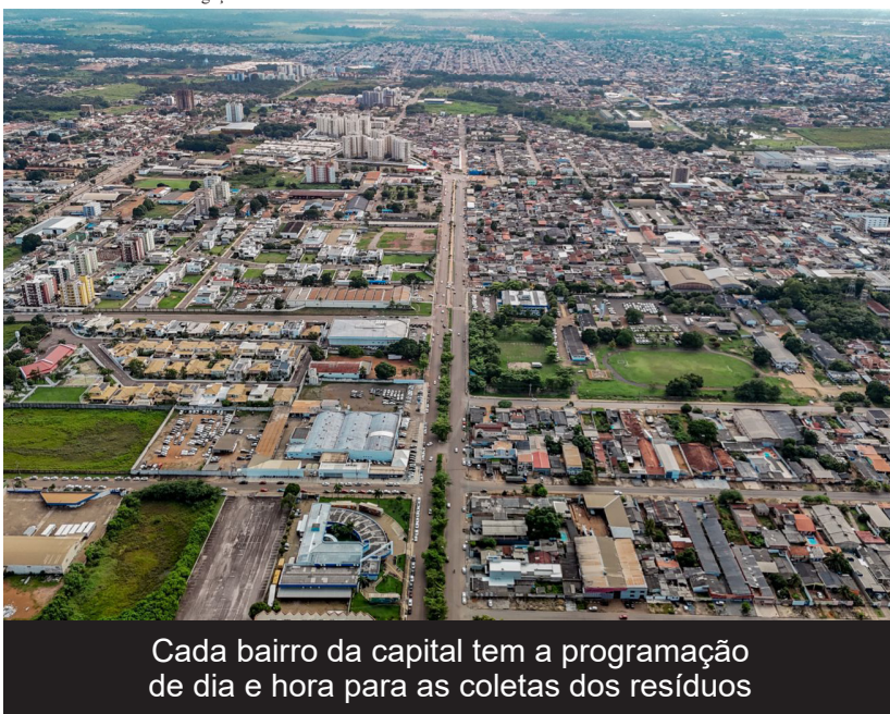
Cada bairro da capital tem a programação de dia e hora para as coletas dos resíduos

(Da Redação) A coleta seletiva tem o objetivo de melhorar a gestão de resíduos sólidos e contribuir para um meio ambiente mais sustentável. A iniciativa está dividida em duas modalidades: a coleta seletiva convencional e a solidária.