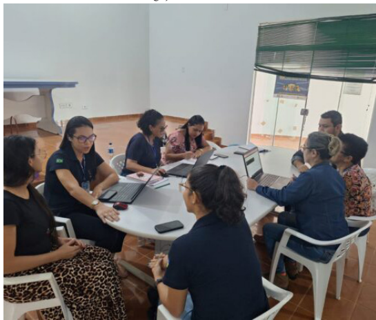
A área georreferenciada abrange o Setor 2, em que cerca de 250 famílias aguardam a titulação definitiva dos imóveis