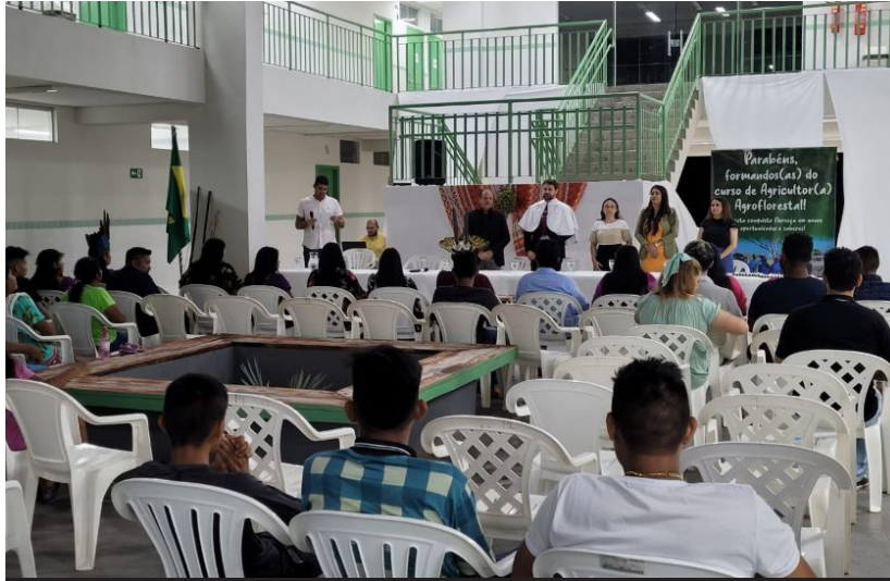
A cerimônia de certificação do curso de Agricultor(a) Agroflorestal faz parte do Programa Biocenomia da Amazônia

(Da Redação) O Instituto Federal de Educação, Ciência e Tecnologia de Rondônia (Ifro), campus avançado São Miguel do Guaporé, realizou no dia 31 de outubro, a certificação do curso de Agricultor(a) Agroflorestal. A iniciativa que faz parte do Programa Biocenomia da Amazônia. O evento ocorreu na Terra Indígena Rio Branco das etnias Tupari e Kampé.