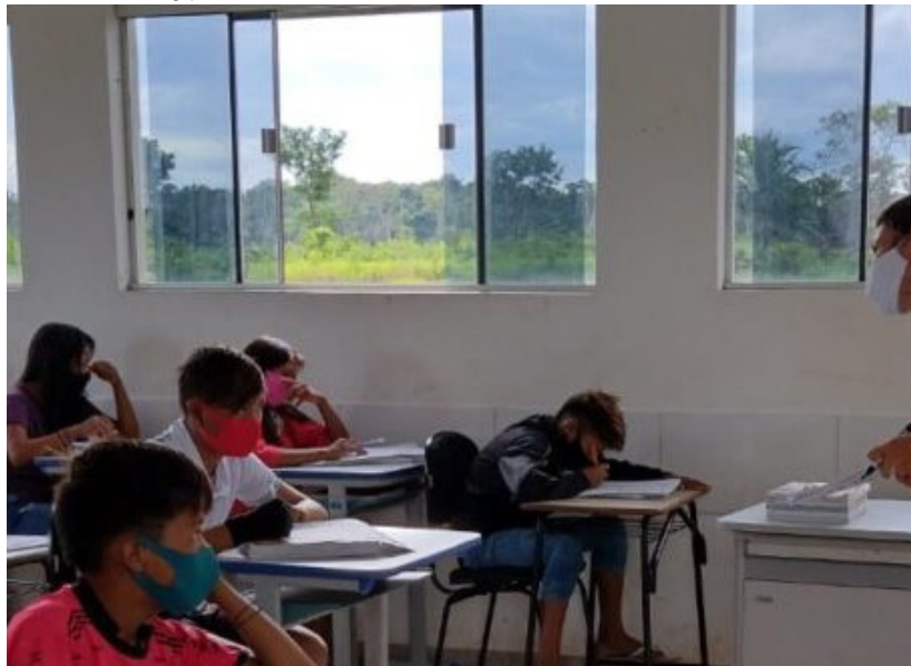
A Seduc atende cerca de 4.500 estudantes indígenas regularmente matriculados em escolas localizadas nas aldeias indígenas

desenvolve a interdisciplinaridade nas respectivas áreas. “É uma forma de fortalecer a educação indígena, prática pedagógica e valorização das diferentes identidades dos povos tradicionais, garantindo o que é proposto nos marcos legais implementados, tornando assim o ambiente escolar um espaço de construção e transformação. Nesse sentido, o governo oportuniza uma ação docente efetiva que promova de fato